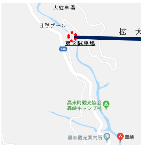
↓ 第2駐車場 (図)