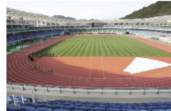
陸上競技場 中央は芝生でサッカーも可