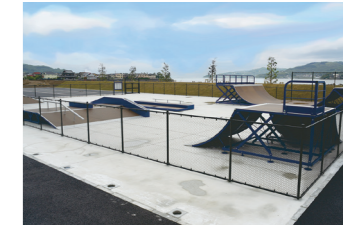
スケートボード場