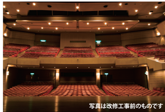
写真は改修工事前のものです

バスケットボール・バレーボール各1面 バドミントン2面 小長井町小川原浦2008-20 ☎0957-34-2111(諫早市小長井支所)