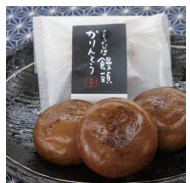
かりんとうまんじゅう