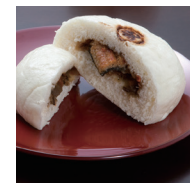
うなぎまんじゅう

うなぎ蒲焼をつかった「うなぎまんじゅう」、手打ちした「高来そば」、揚げたて「かりんとうまんじゅう」など諫早の郷土料理の店や、祭りを盛り上げてくれる露店、うどんなど、出店多数。みんなでうまかもんば食べにきんしゃい。生ビールもあるよ!